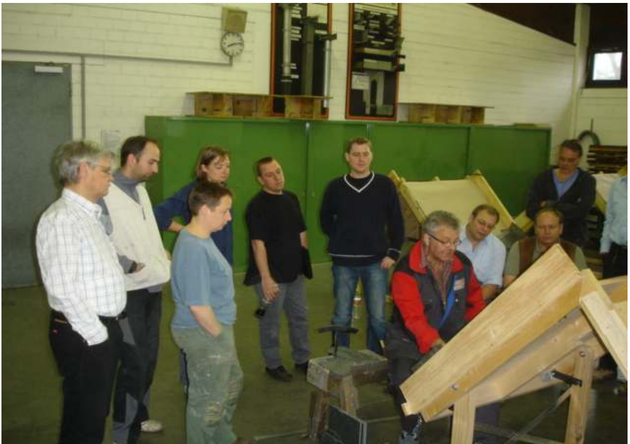
Für die Details am Steildach (hier: Einbau von Dachhaken) gab es Hinweise vom Meister!