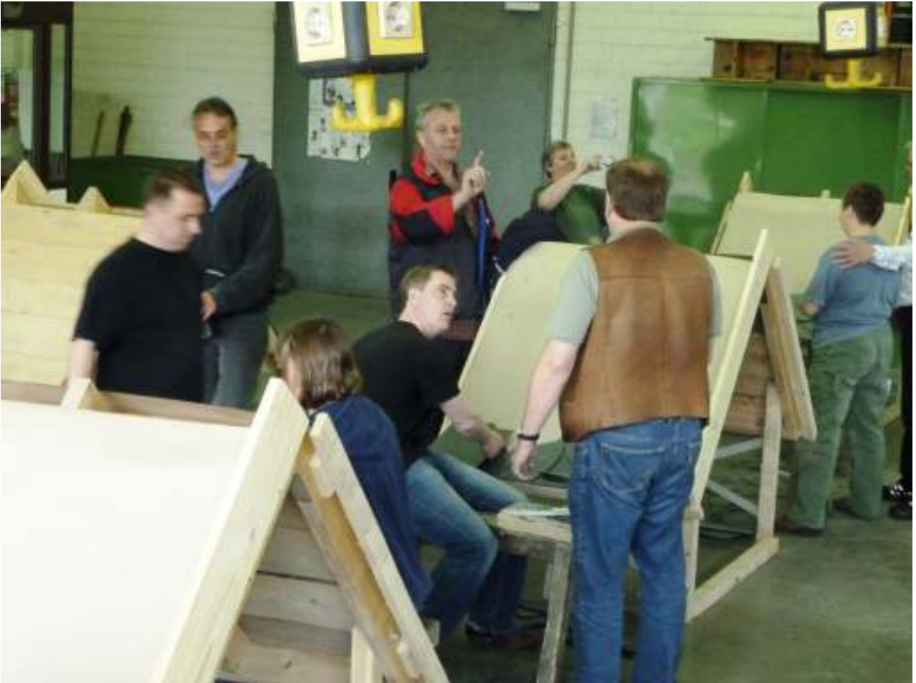
An Dachmodellen (Dachneigung DN = 45^\circ ) wurde die Al tdeutsche Schieferdeckung mit Gebindesteigung und eingebundenen Fuß geübt, geprobt und weiter geübt.